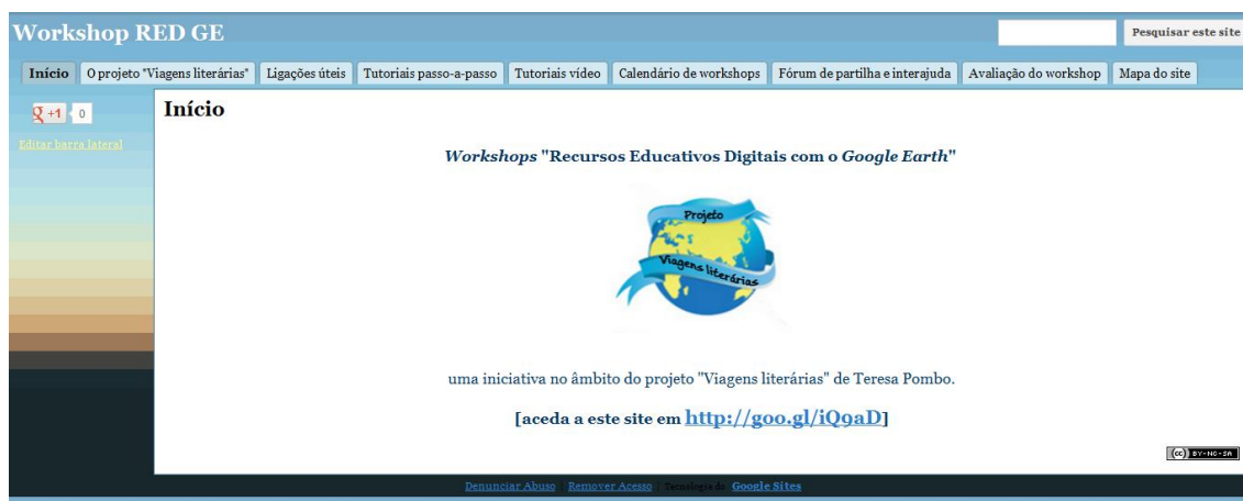
Fig. 1 - Sítio web de apoio aos workshops

acessível de mostrar aos participantes o contexto do workshop , deixar hiperligações interessantes como sugestão, apresentar o questionário de avaliação e, sobretudo, reunir pequenos tutoriais que, a distância, poderão apoiar os docentes que desejem colocar em prática o que aprenderam e começaram a realizar durante o workshop presencialmente. Assim, a estrutura de navegação distribui-se por nove áreas, a saber: Início / Apresentação do projeto “Viagens literárias” / Ligações úteis / Tutoriais passo-a-passo / Tutoriais vídeo / Calendário de workshops / Fórum / Avaliação / Mapa do site.