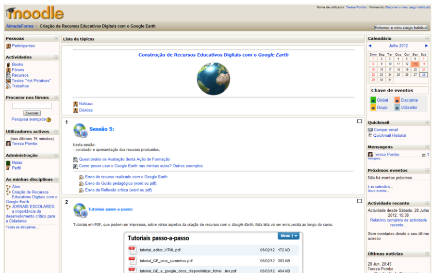
Fig.3 - Aspeto geral da página Moodle de apoio ao primeiro Curso de Formação

Imagens históricas; Céu, Marte e Lua; Gravar filmes com percursos; Organizar, guardar e enviar pastas com marcadores e ficheiros.